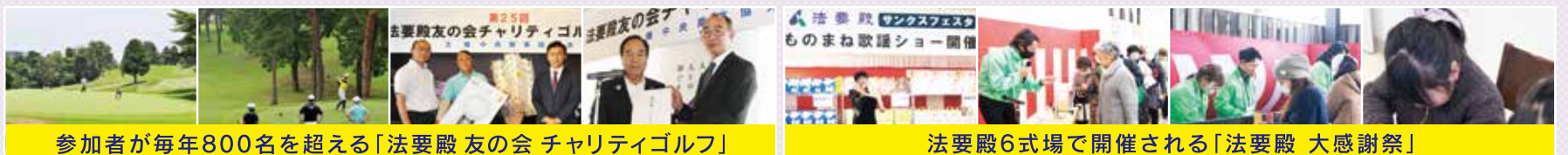
参加者が毎年800名を超える「法要殿 友の会 チャリティゴルフ」

友の会各種イベントや感謝祭により、地域の方々に感謝の気持ちを還元させていただいています。