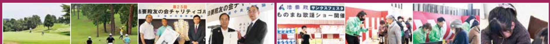
参加者が毎年800名を超える「法要殿 友の会 チャリティゴルフ」

友の会各種イベントや感謝祭により、地域の方々に感謝の気持ちを還元させていただいています。